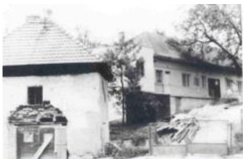
Stará pôvodná požiarna zbrojnica – stála v uprostred cesty dnešnej Dubnickej ulice