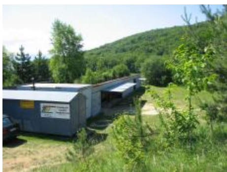
Futbalové ihrisko – vybudované v roku 1985