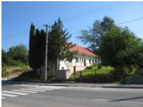
Súčasný stav v roku 2006

Bývalá škôlka - Predtým miestna ľudová škola otvorená 4 mája 1901, Národná škola (1922 – 1961), materstvá škôlka (1961 – 2005), Ľudová škola umenia v Bojniciach od 2005.