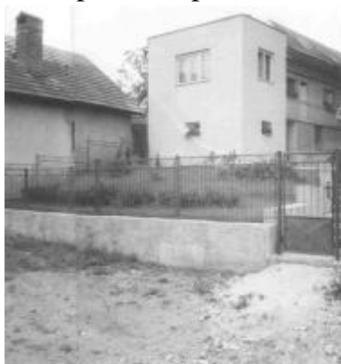
Stav po roku 1961 pre postavením dnešnej Dubnickej ulice